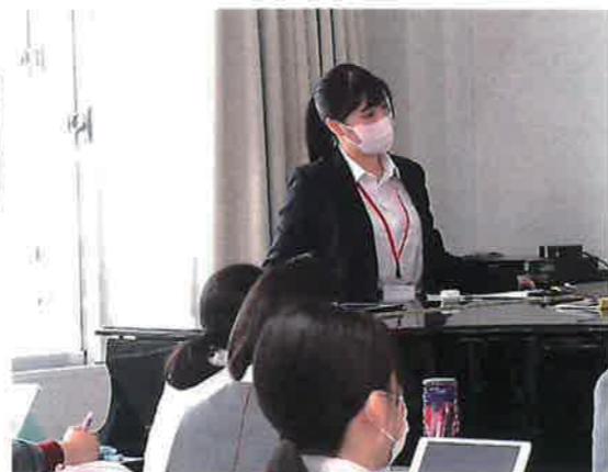
(上・下)前期2回実習生による授業の様子です。

私にとって、3週間の教育実習はとても長いと感じました。大学生だった日常から急に教員として生徒の前に立ち、教える事のギャップにしばらく慣れることができず、とても苦勞しました。授業をする度に、自らの性格についてや欠点ばかりが目につき自らを見直す良いきっかけとなりました。他人とのコミュニケーションが苦手だと感じている私にとって、大勢の人の前に立って話すという経験は、とても有意義なものとなりました。話す言葉の選び方や目線の送り方など、社会人として人に何かを伝える際に大切なことを実際の現場で直接学ぶ事ができました。この3週間の教育実習を経て、大勢の人の前に立って話す事への恐怖と不安が無くなり、改善すべき点や工夫すべき点を見つけられたことは、これからの人生に活かすことのできる経験であると思います。本校の卒業生として、後輩達の成長を短い期間ではありましたが、側で見る事ができてとても嬉しい気持ちになりました。実習を受け入れてくださった先生方、そして生徒に感謝の気持ちでいっぱいです。ありがとうございました。